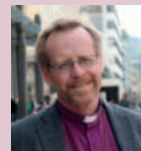
Biskop Halvor Nordhaug side 16