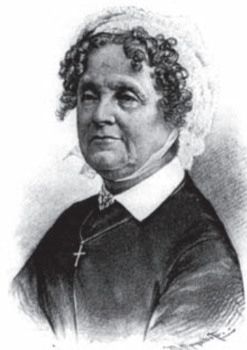
Gustava Kielland skrev sangen "Å jul med din glede". KPK-illustrasjon: Skilling-Magazinet.

5. Om ute det stormer og regner og sner, det kan oss jo slett ikke skade. For julen og freden oss alle er nær, og vi ere fromme og glade.