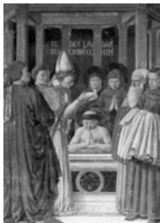
Biskop Ambrosius av Milano døyper Augustin.

Dette er òg eit godt ord for adventsfeiringa, som skal førebu oss rett på at Kristus kjem. For òg denne heilage julefesten vil Herren ta inn i våre liv, i våre heimar, i samfunn-og kyrkje.