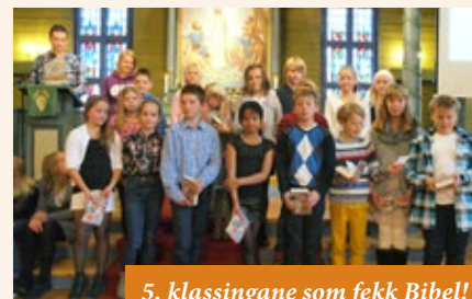
5. klassingane som fekk Bibel!