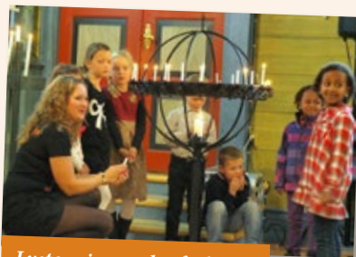
Lystening under forbøna.