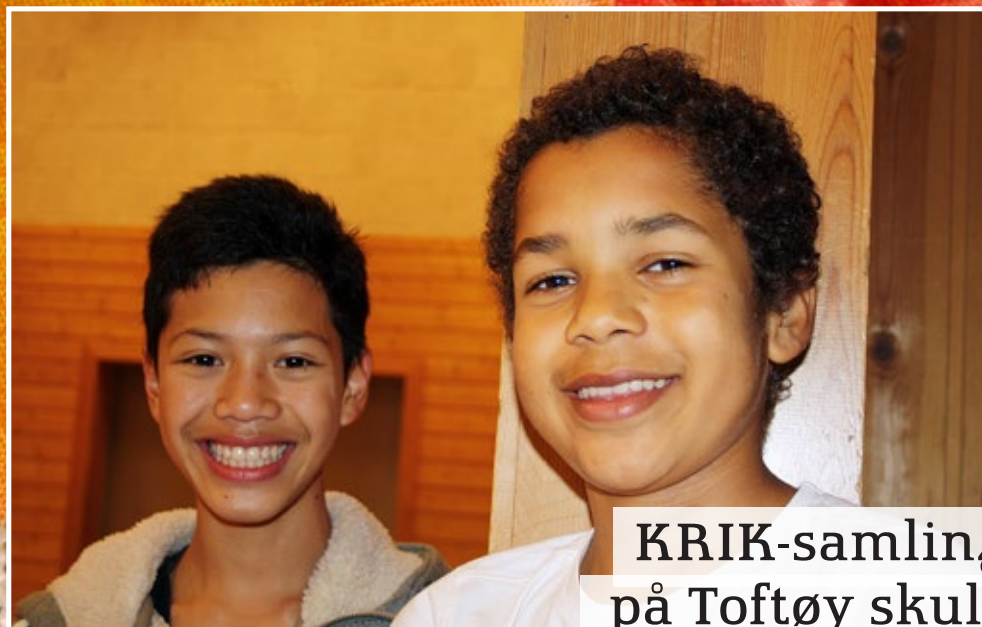
KRIK-samling på Toftøy skule