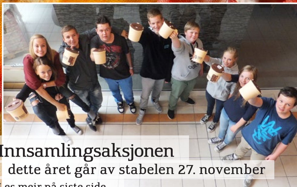
Innsamlingsaksjonen dette året går av stabelen 27. november