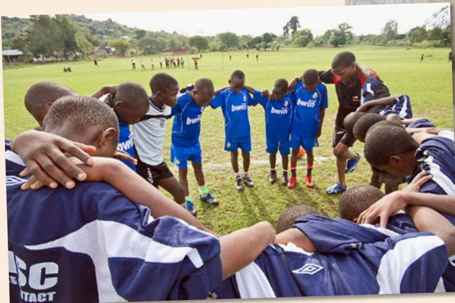
Ungdommar som ber før ein fotballkamp i Tanzania.