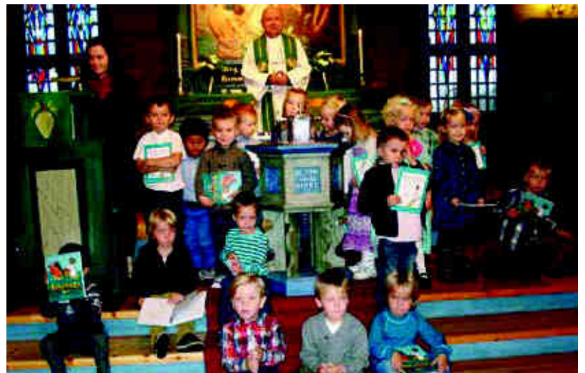
Glimt frå utdeling til 4-åringar i Blomvåg 23. oktober.