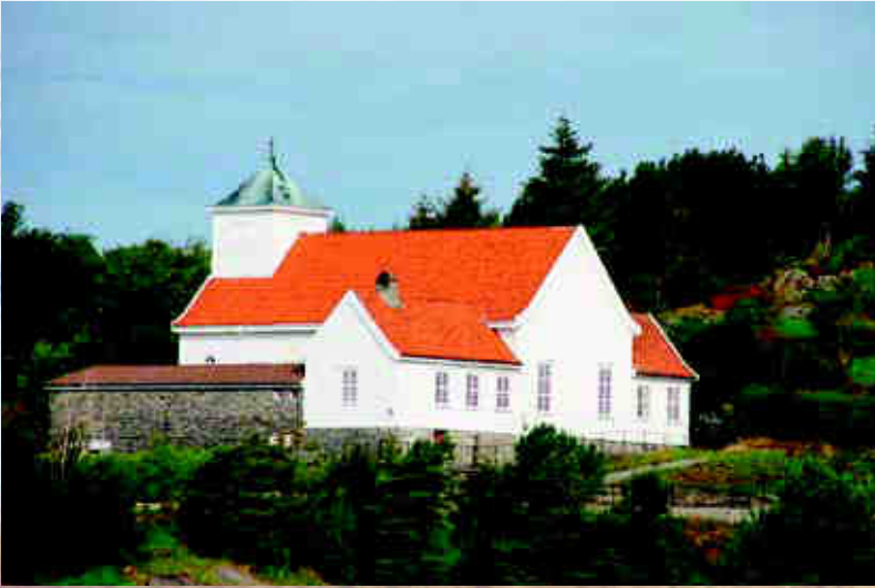
Blomvåg kyrkje 80 år i 2011 Innvidg i 1931