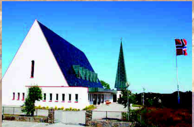
Hjelme kyrkje 40 år i 2011 Innvidg i 1971