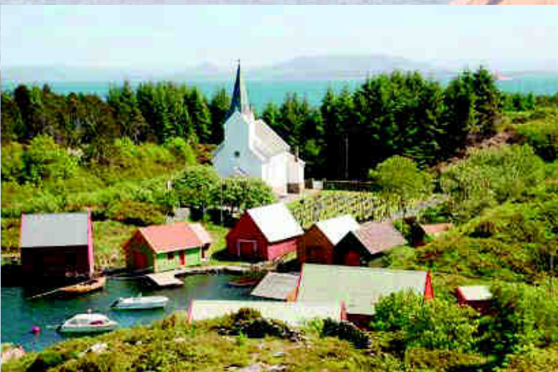
Hjelme gamle kyrkje Frå 1875