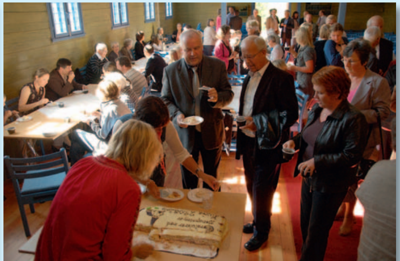
Frå kyrkjekaffien etter gudstenesta.