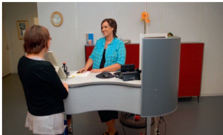
NAV har fått gode lokale for å yta service til brukarane sine