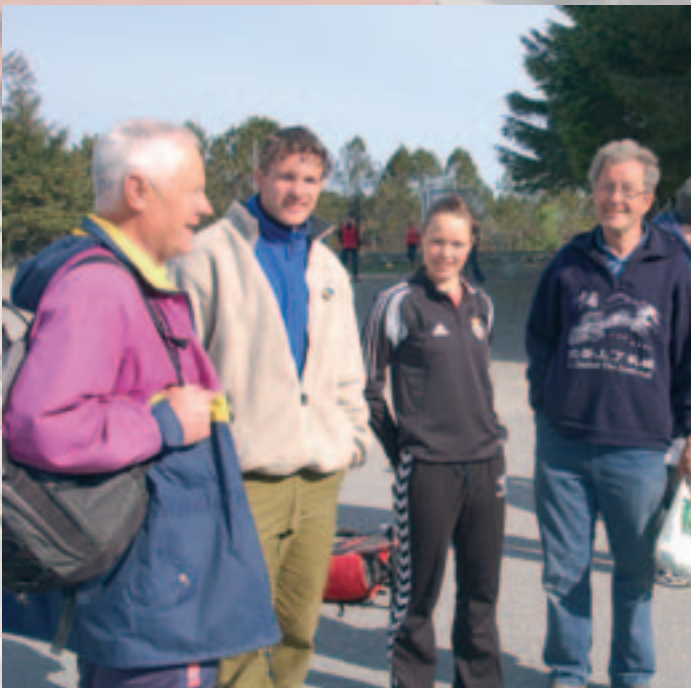
Ein del av lærarane denne veka

Denne fine dagen stod ei gruppe klar til fisketur, arbeid med garn og teiner og opplæring i enkel navigasjon. Skjergardsheimen tilbyr elles både fjellklatring, rappellering, kanopadling og studie av livet i fjøra.