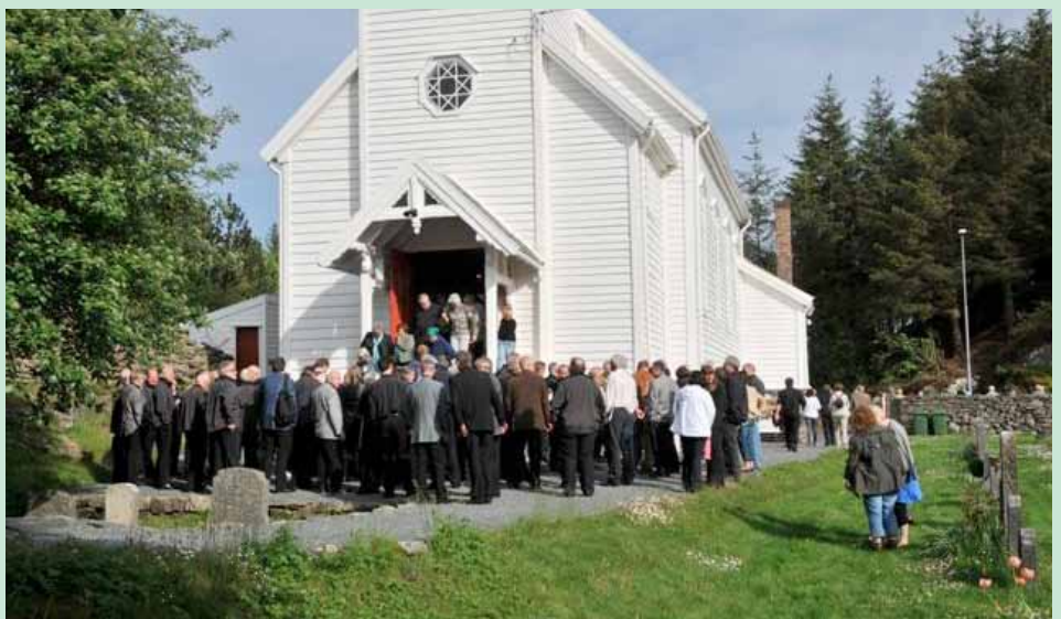
På kyrkjebakken.

Tidlegare leiar av Bakken nærmiljøutval, Sjur Meling, meddelte forsamlinga at konserten resulterte i ei gåve til Hjelme gamle på kr. 11.000,-. Kyrkjekontoret i Øygarden vil no få overrekt ein sjekk på til saman kr. 16.000,- som er innsamla på dugnad til kyrkja i nord.