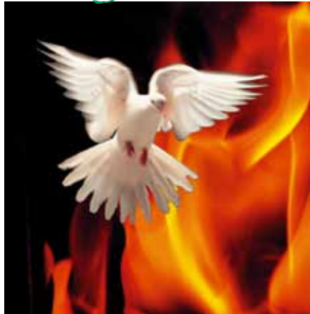
PINSE: Ei kvit due og ildtunger er i Bibelen brukt som teikn på Den Heilage Ande.

I påsken blei dei satt fri frå slaveriet,