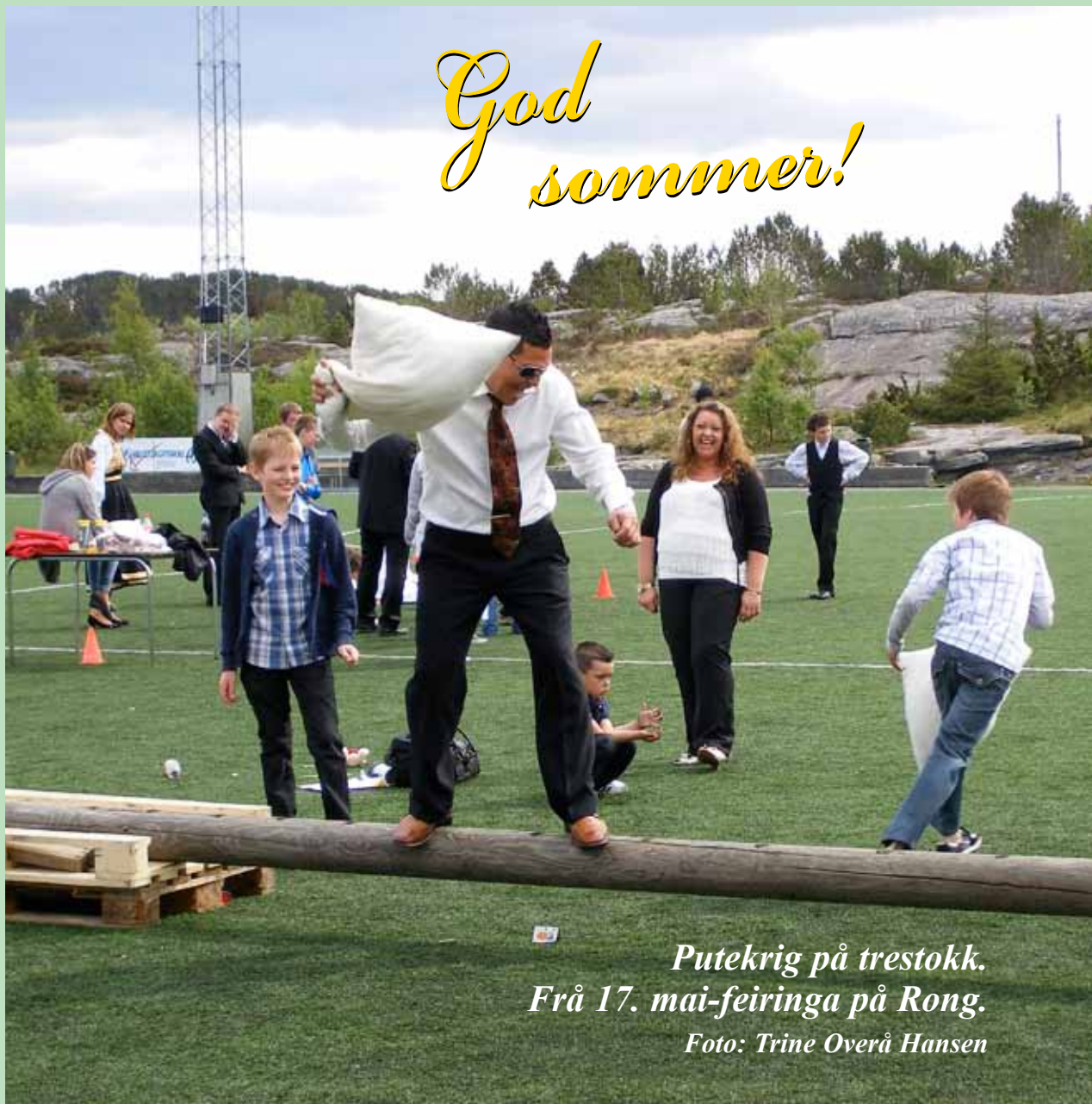
Putekrig på trestokk. Frå 17. mai-feiringa på Rong.