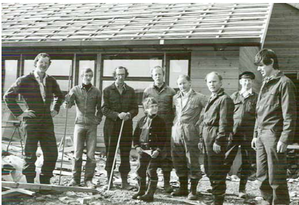
Øygardsgjeng på dugnad på Bibelskulen, Bildøy året 1983