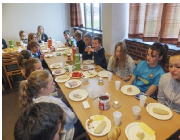
Ein trøtt gjeng på frukost torsdag morgon.