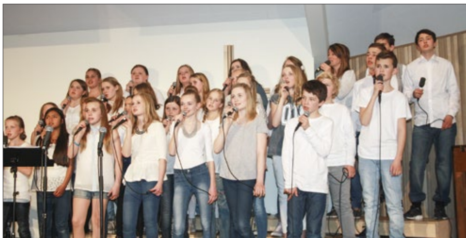
Frå konserten på Bømlo.