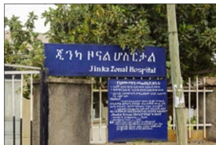
Porten inn til Jinka hospital