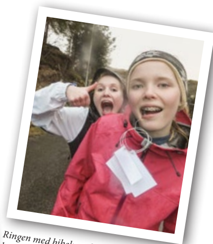
Ringene med bibelvers kan praktisk hengast i strengen.