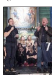
Svenn Gospellnight 2011.

Eg vil på eit seinare tidspunkt skrive meir om erfaringane eg har gjort i mi prestateneste i Den norske kyrkja, ikkje minst om korleis denne kyrkja har endra seg i liberal og negativ retning, og avstanden mellom leiarskapet og oss på «golvet» vert større og større. At eg likevel har stått i Den Heilage Tenesta så