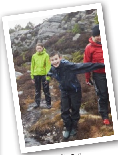
På den gamle kyrkjevegen.