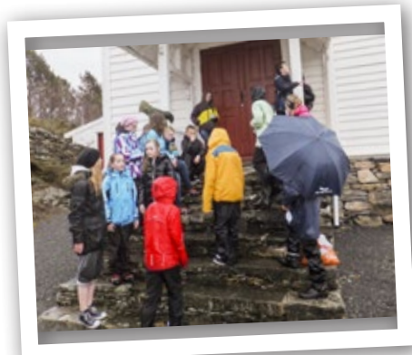
Andakt på kyrkjetrappa.

nattkino med Camilla og tyven 2. Det vart seint før alle var klar til å legga seg, men til slutt hadde alle fått rigga seg til. Nokon inne i kyrkja, mens nokon slo seg til i lavvo på kyrkjeplenen. Det tok endå eit par timar før alle var klar til å sova, men freden senka seg litt utpå natta! Etter god frukost og ord for dagen, kunne alle reisa fornøgd heim torsdags morgon. Kanskje kan dette bli ein ny tradisjon?