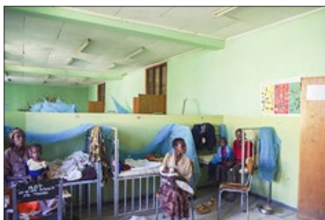
Frå ein sjukehussal.

Det å koma til Etiopia og Jinka er ei stor oppleving, – få sjå kontrastane i måten å leva på. Og dette å få besøka Jinka Hospital og høyra ulike hendingar og kva ein er med på å få hjelpa til. Få samanlikna norsk sjukehusstandard med etiopisk, få sjå kva ein kan få utretta med enkle midlar og at pengane vert godt brukte.