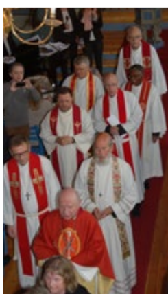
Presteprosesjon, Avskilsgudsteneste 12. mai i år.