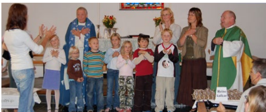
Gudsteneste i Hjelme. Bispevisitas 2006.