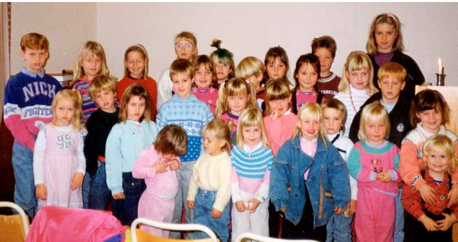
Blomvåg Søndagsskule 1990.