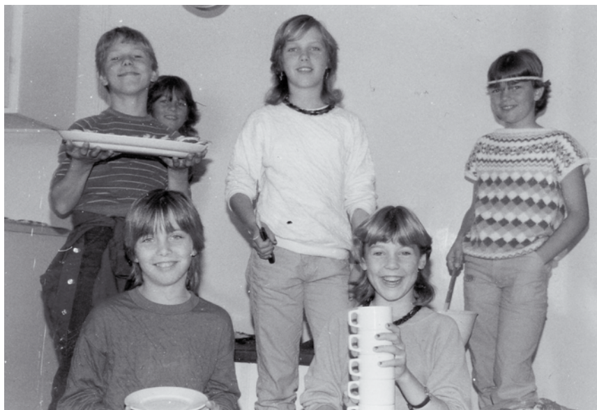
«Ein gjeng frå barnelaget «Spiren» på Rong. Avslutningsfest –84».