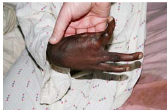
Brannskade, Jinka sjukehus.