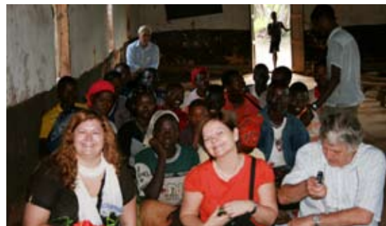
På gudsteneste nær Jinka.