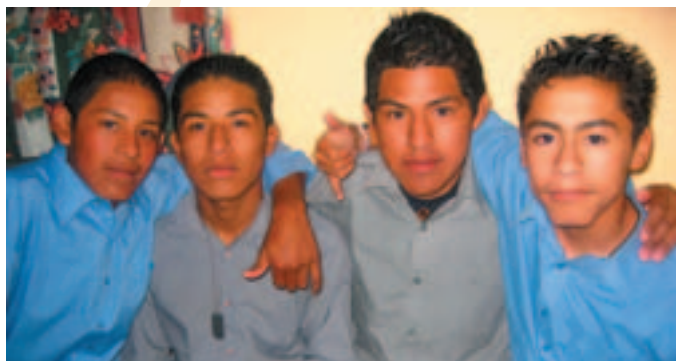
Gutane frå Jesus Maestro fann fram fin-skjorta til feiringa på nyttårsaftan