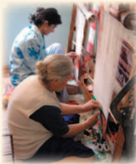
Teppeknyting i flyktningeboligen