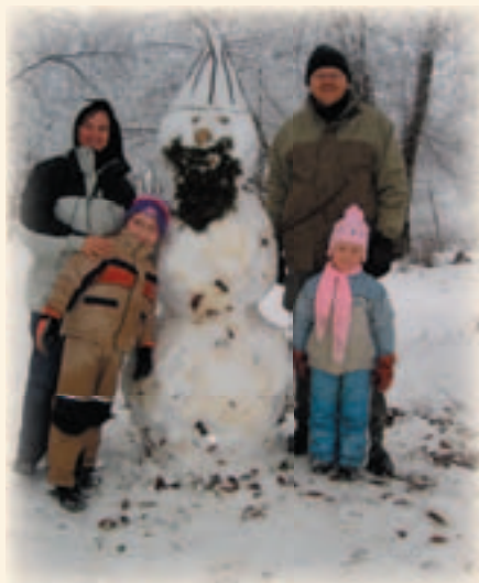
Snømann i langeskogen

På grunn av litt uro i landsbyen har det vorte ein pause i kurset, men det vert jobba med å fortsetje. Be om at det må lukkast.