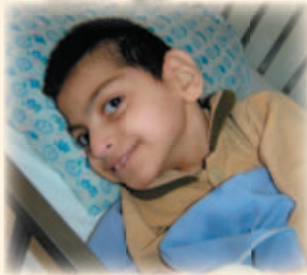
Ei av jentene på barneheimen som klarar å smile

Då seier husverten: "Ja, eg trur dette som står her (viste sitt litle godt brukte russiske nytestamente), men eg har ikkje tatt imot Jesus enno. Korleis kan eg gjere det?" Me forklarte korleis han kunne be for å ta imot. Ein frå omsetjingsteamet hadde nett skrive ei vedkjennings bøn på deira lokalspråk. Mannen fekk lese gjennom den, og nikka bekreftande at det var dette han ville seie. Så bad han bøna i påhør av alle saman. "Amen", svarta me bekreftande. Like etterpå kom den nysteikte kalkunen på bordet, og me feira saman. Dette vart litt av ein festkveld, og litt av ein start på alfa-kurset. Den nyomvendte peikar på ein annan kar som var med for fyrste gong. "Han har heller ikkje tatt imot enno, men han er også klar." Han måtte tenkje seg litt om.