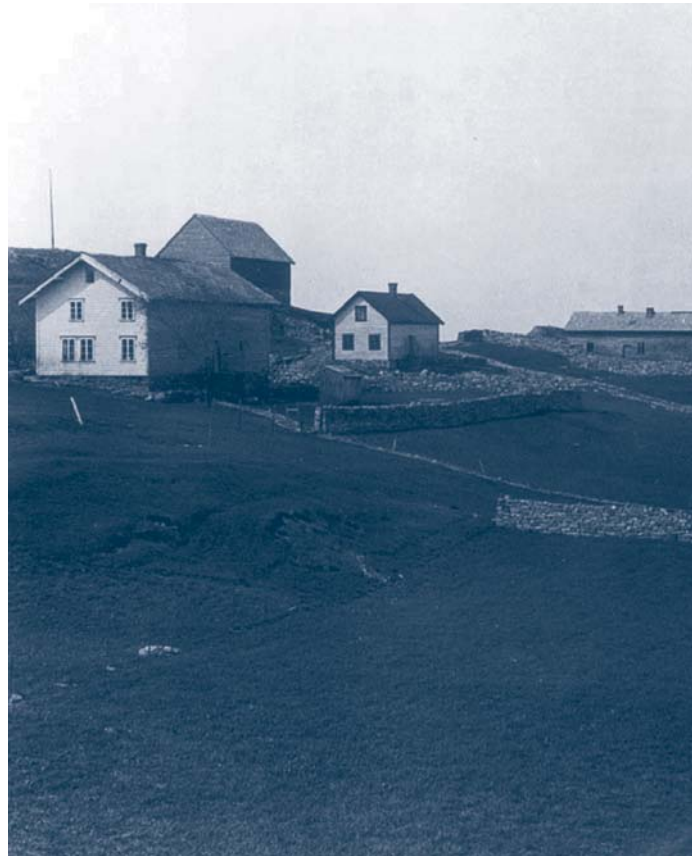
Systervo på Rong, det store, kvite huset heilt t.v.i.biletet.

I den katolske tid pleiet ektebustruene å innledes med et tent lys i sin hånd, som tegn på at de skulde ha sitt lys brennende. Enkelte steder var det skikk, at hvis barnets mor døde, før hun hadde holdt sin kirkegang, tok en nabokone og iførte seg avdødes klær og holdt kirkegang i hennes sted. Skikken spillet dengang langt større rolle enn nu. Skikken måtte ikke brytes. Den vakre gamle skikk med mødres kirkegang er dessverre nu vistnok ikke lenger i bruk.