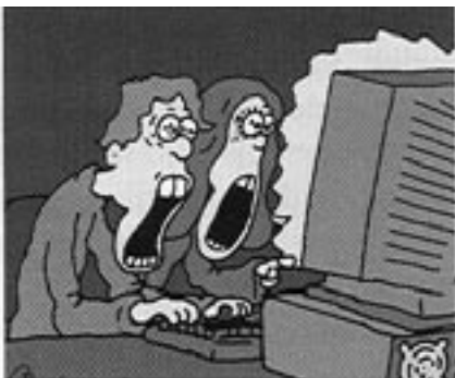
Illustrasjoner: Frøde Kalleland

Frist for stoff til nr. 3/05 er 24. mai.