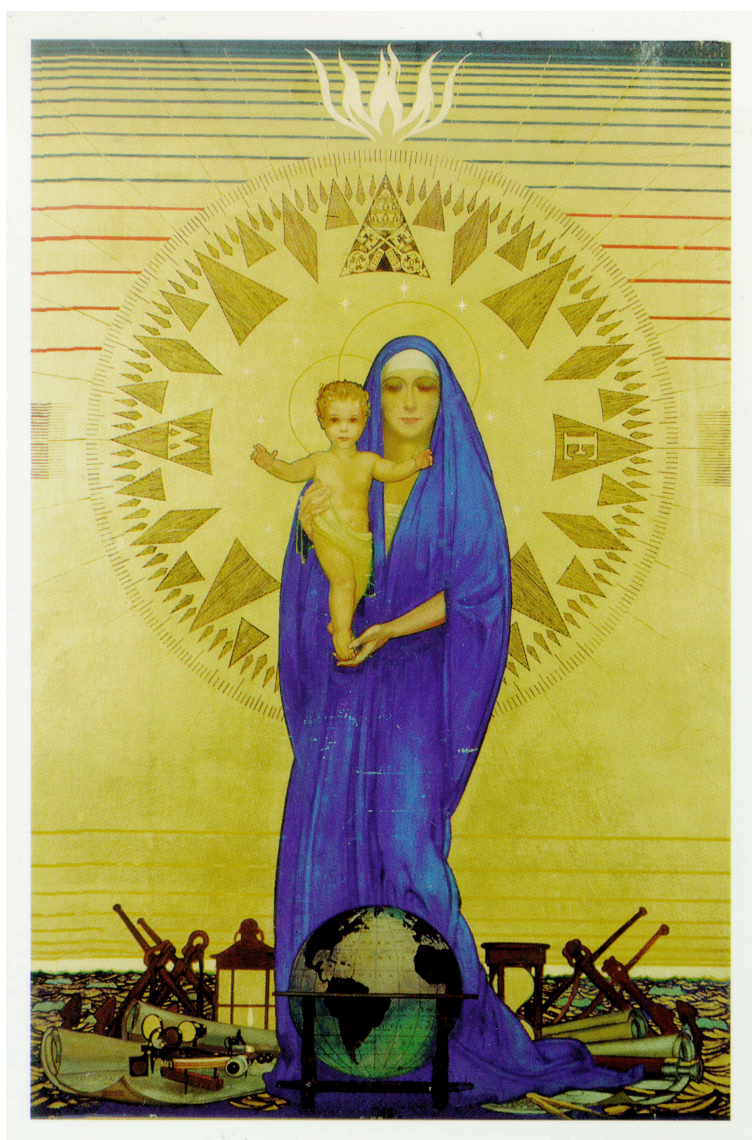
Stella Maris. Fra Queen Mary, Long Beach, CA

Ved Guds barmhjertighet formaner jeg dere, brødre, til å bære legemet fram som et levende og hellig offer som er til Guds behag. Det skal være deres åndelige gudstjeneste. Og la dere ikke lenger prege av den nåværende verden, men la dere forvandle ved at sinnet fornyes, så dere kan dømme om hva som er Guds vilje: det gode, det som er til hans behag, det fullkomne. I kraft av den nåde jeg har fått; sier jeg til hver enkelt av dere: Gjør deg ikke større tanker enn du bør; men bruk din forstand og vær sindig! Hver og en skal holde seg til det mål av tro som Gud har gitt ham. Vi har ett legeme, men mange lemmer, og alle lemmene har forskjellige oppgaver. På samme måte er vi alle ett legeme i Kristus, men hver for oss er vi hverandres lemmer, Vi har forskjellige nådegaver, alt etter den nåde Gud har gitt oss. Den som har profetisk gave, skal bruke den slik som troen tilsier; den som har diakontjeneste, skal ta seg av sin tjeneste. Den som er lærer, skal ta seg av læren, og den som rettleder, skal ta seg av dette; den som gir av det han eier, skal gi det av et udelte hjerte. Den som er forstander, skal være det med iver, og den som gjør barmhjertighet skal gjøre det med glede. Vis oppriktig kjærlighet, avsky det onde og hold dere til det gode. Elsk hverandre inderlig som søsken, sett de andre høyere enn dere selv. Vær ivrige og bli ikke slappe, vær brennende i Ånden, tjen Herren! Rom 12,1-11